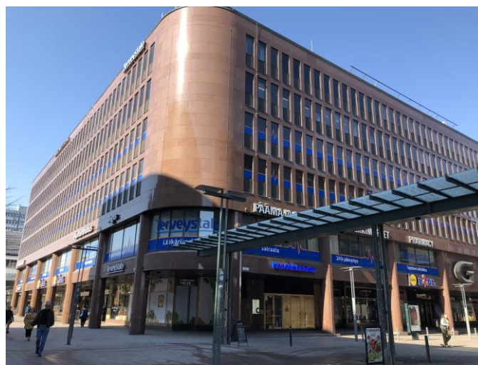
Kuva 2 – yleiskuva Graniittitalosta Kampista katsottuna